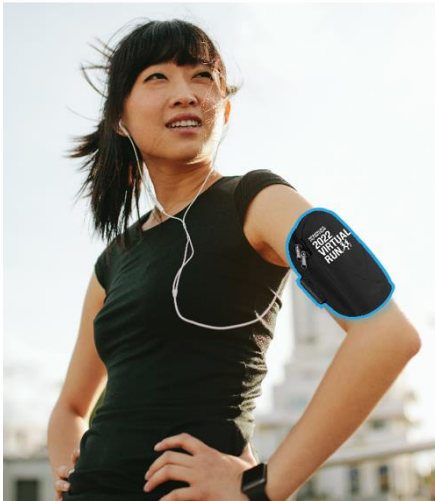
运动臂章 200公里及以上个人成绩

数量有限，送完即止，2022年11月1日至30日期间完成以下累积距离并提交完成证明的个人成就者将有机会获得相应的礼物。