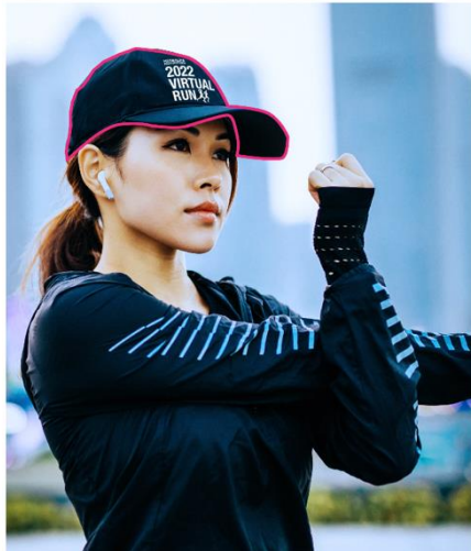
运动帽 300公里及以上个人成绩