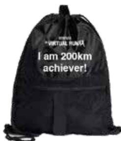
巾着タイプのバッグ (数量限定)