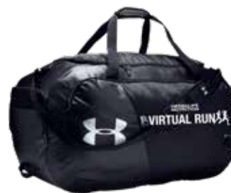
アンダーアーマーのジムバッグ (数量限定)