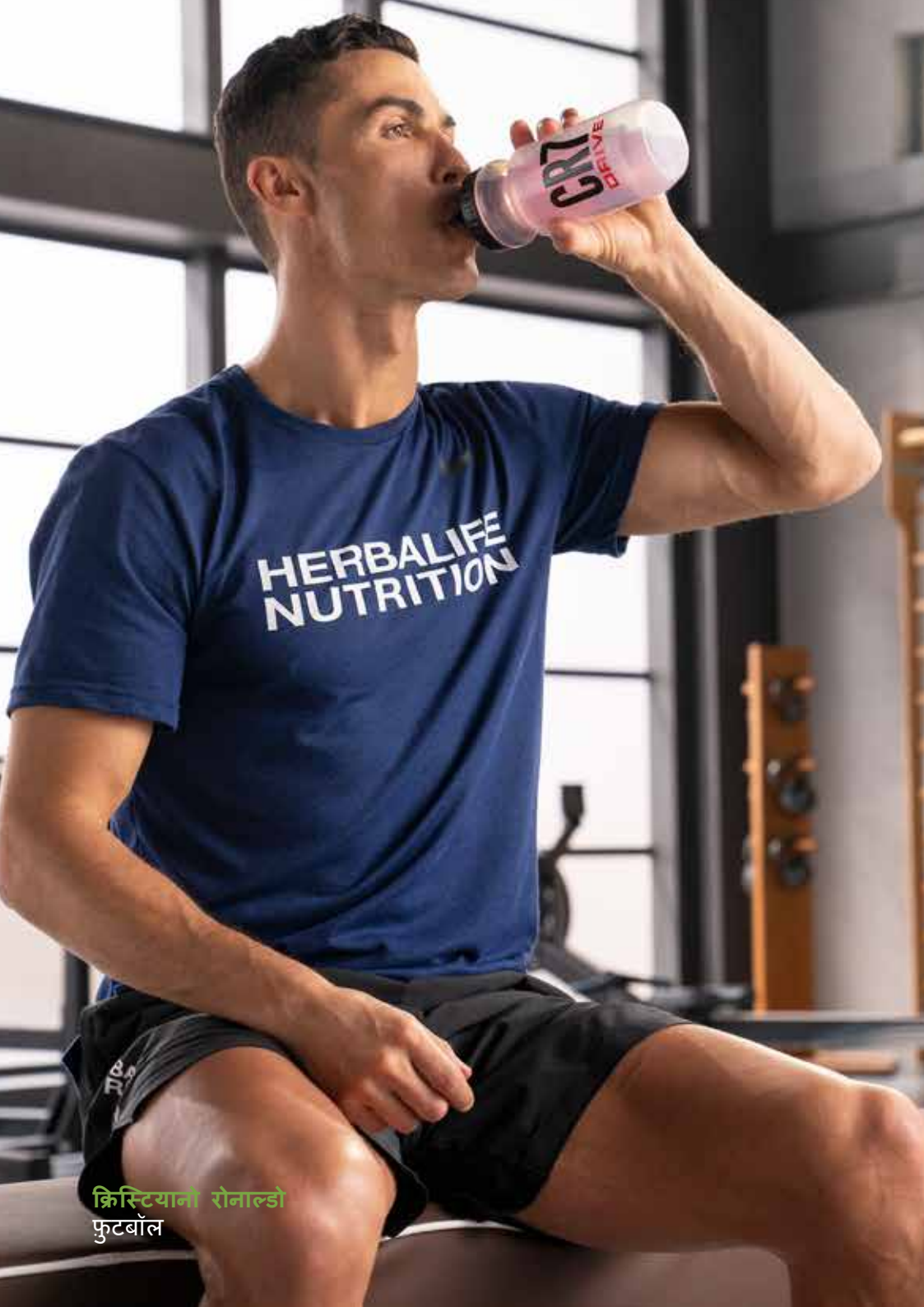
क्रिस्टियानो रोनाल्डो फुटबॉल